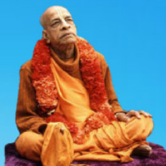
గురు భక్తవేదాంత ప్రభుపాద